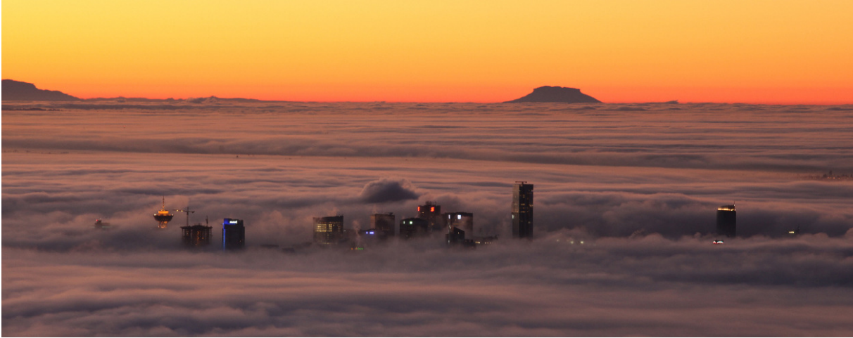
Fig. 1. In the Clouds: Vancouver from Cypress Mountain.

Roy G. Biv, Ed Grimley, Member, IEEE , and Martha Stewart